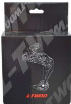
CAJA CAMBIO TRASERO