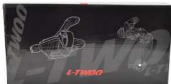
CAJA SET 2 PCS