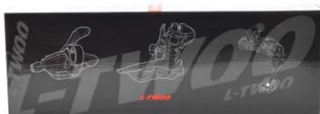
CAJA SET 3 PCS